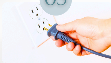
コンセント利用可